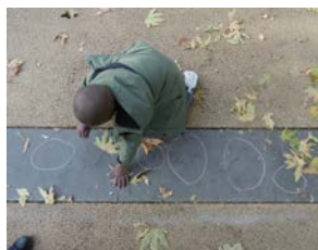
École maternelle La Saïda, 15 e