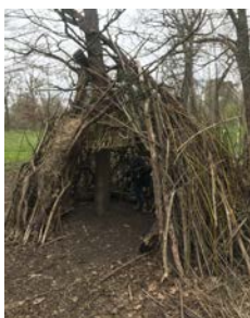
École maternelle de Reuilly, 12 e

▶ Vous pourrez retrouver des informations sur les bois parisiens ici : Bois de Vincennes 2 / Bois de Boulogne 3