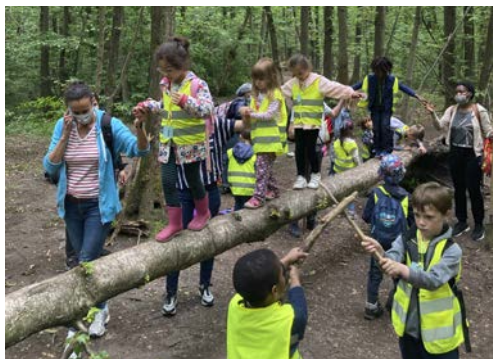
Ecole maternelle La Saïda, 15 e