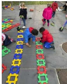
École maternelle La Saïda, 15 e

▶ Pour plus d'informations, consultez différentes expérimentations parisiennes 1