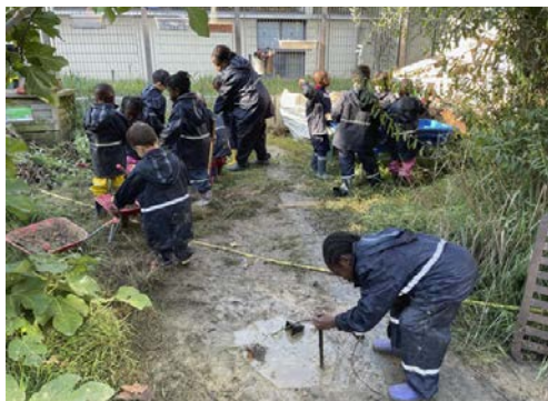
Ecole maternelle La Saïda, 15 e