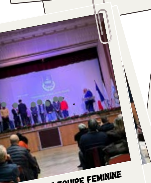
MEILLEURE EQUIPE FEMMINE 2023 AU TROPHEE PARISIEN DU SPORT