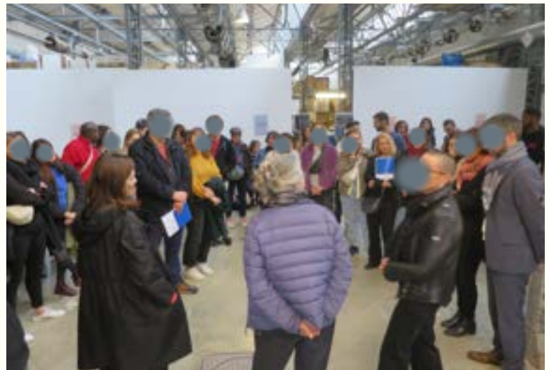
PLénière du REP+ BESSON