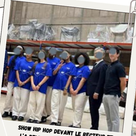
SHOW HIP HOP DEVANT LE RECTEUR ET L'A DELEGATION JAPONIAISE POUR LA PASSATION DES JO DE TOKYO À PARIS AU MOBILIER NATIONAL