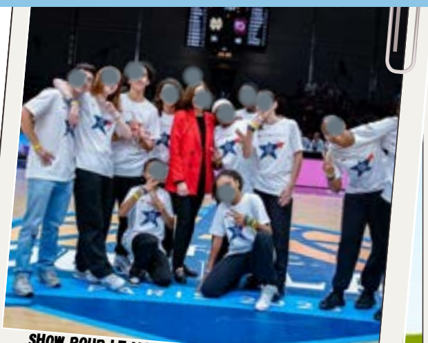
SHOW POUR LE MATCH D'OUVERTURE DE LA SAISON UNIVERSITAIRE NCAA (NATIONAL COLLEGIATE ATHLETIC ASSOCIATION) DEVANT L'AMBASSADRI DES USA