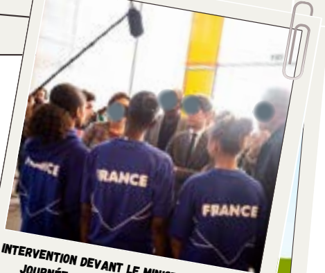
INTERVENTION DEVANT LE MINISTRE LORS DE LA JOURNÉE OLYMPIQUE ET PARALYMPIQUE