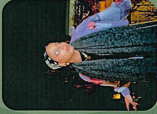
Ritage - suppléante (Henri IV)